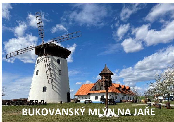
BUKOVANSKÝ MLÝN NA JAŘE